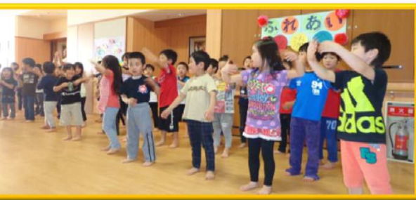
元気なダンスを披露してくれました!