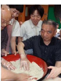
一緒に作りました。