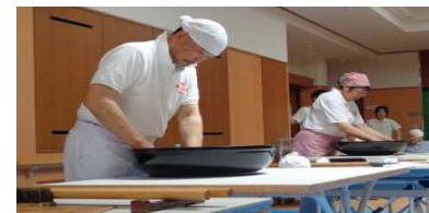
全十勝手打ち蕎麦推進協議会の皆様、ありがとうございました。