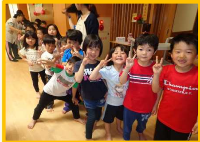
来年も待っていますね!